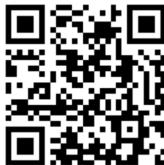
ランランひろば電子申請用二次元バーコード