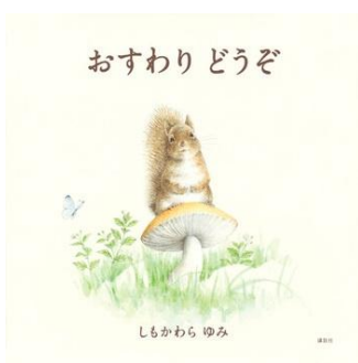
「おすわりどうぞ」 作・しもかわら ゆみ

動物たちのふわふわの毛並みと、やさしい表情にほっこりするしもかわらゆみさんの絵本です。りす、かえる、はりねずみ、きつね、しか、いのししも、みんなぴったりのいすを見つけられるかな…？