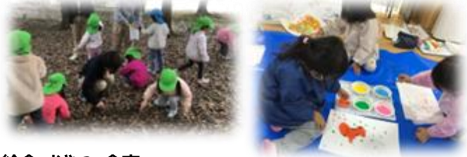
※1日の流れは園児の状況・年齢によって変更する場合があります。